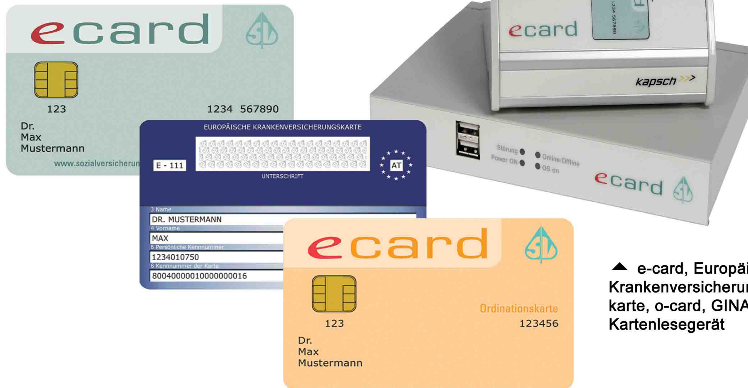
▲ e-card, Europäische Krankenschein-karte, o-card, GINA und Kartenlesegerät

Auswertung Bewertungsbogen ▶ Stichprobengröße: 25 Probanden GE ... Grundsätzliche Einstellung 1 ... sehr positiv 2 ... eher positiv 3 ... neutral 4 ... eher negativ 5 ... sehr negativ